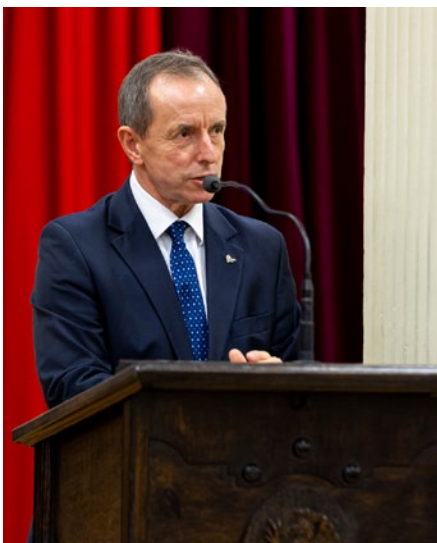
Marszałek Senatu RP prof. dr hab. n. med. Tomasz Grodzki

Na zakończenie uroczystości wysłuchaliśmy wspaniałego koncertu kwartetu smyczkowego, po którym nie mogło obyć się bez wykonania pamiątkowych zdjęć. W trakcie odbywającego się po uroczystości poczęstunku mogliśmy podsłuchać, że taka formuła przyjęcia do wielkiej lekarskiej rodziny bardzo naszym Koleżankom i Kolegom przypadła do gustu.