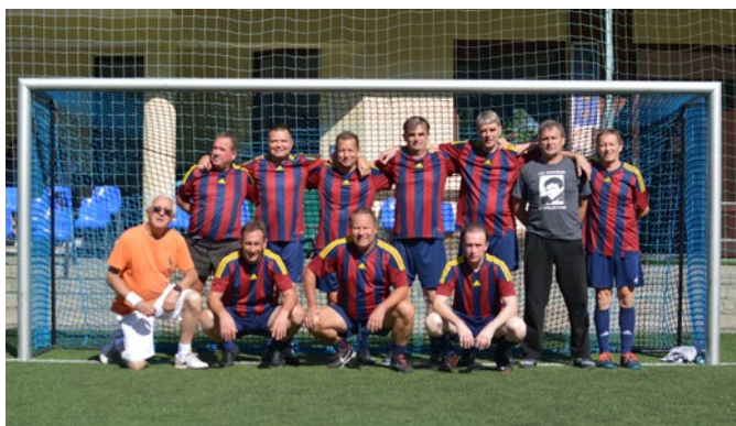
Fot. 1. Drużyna seniorów – „młodzi duchem”