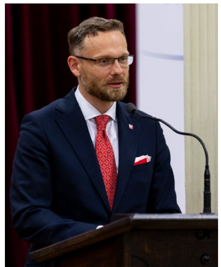
Wojewoda Zachodniopomorski Zbigniew Bogucki