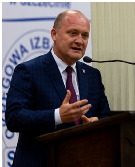
Prezydent Miasta Szczecin Piotr Krzystek