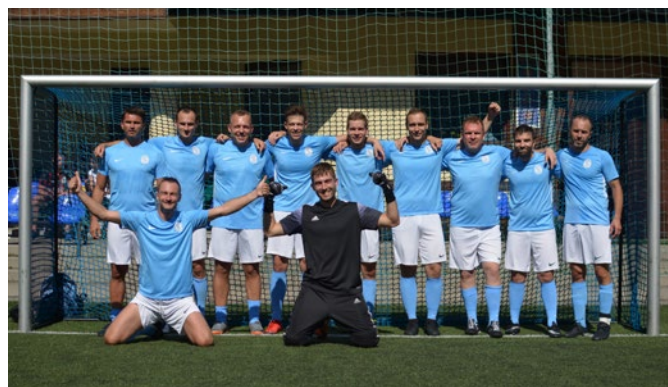
Fot. 2. Drużyna „open” – „młodzi PeSeL-em”