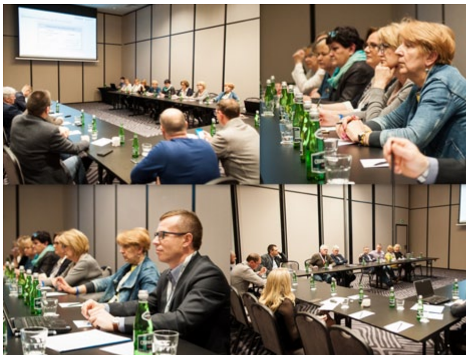
Uczestnicy sesji samorządowej